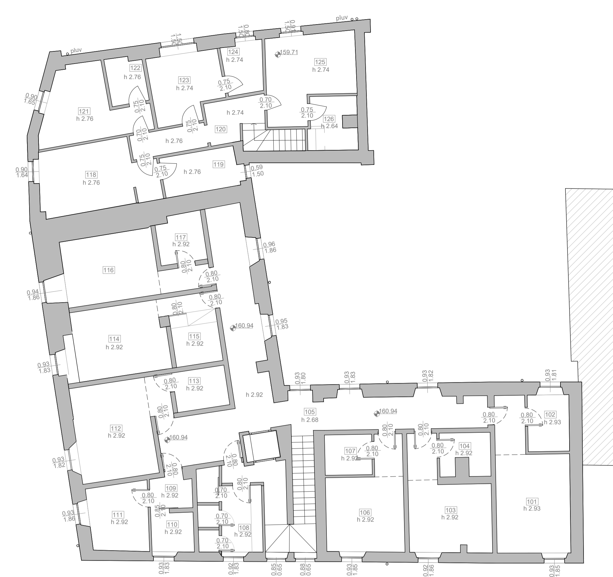
PLANIMETRIA PIANO PRIMO SCALA 1:100

N.B. ● I LOCALI CONTRASSEGNA TI CON QUESTO SIMBOLO AVRANNO ASPIRAZIONE FORZATA IN GRADO DI RICAMBIARE 12 VOL/H * I LOCALI CONTRASSEGNA TI CON QUESTO SIMBOLO NON PREVEDONO PERMANENZA DI PERSONE ▲ I LOCALI CONTRASSEGNA TI CON QUESTO SIMBOLO SONO DOTATI DI IMPIANTO DI CONDIZIONAMENTO ARIA A NORMA R.L.I v.m.e VENTILAZIONE MECCANICA CONTROLLATA