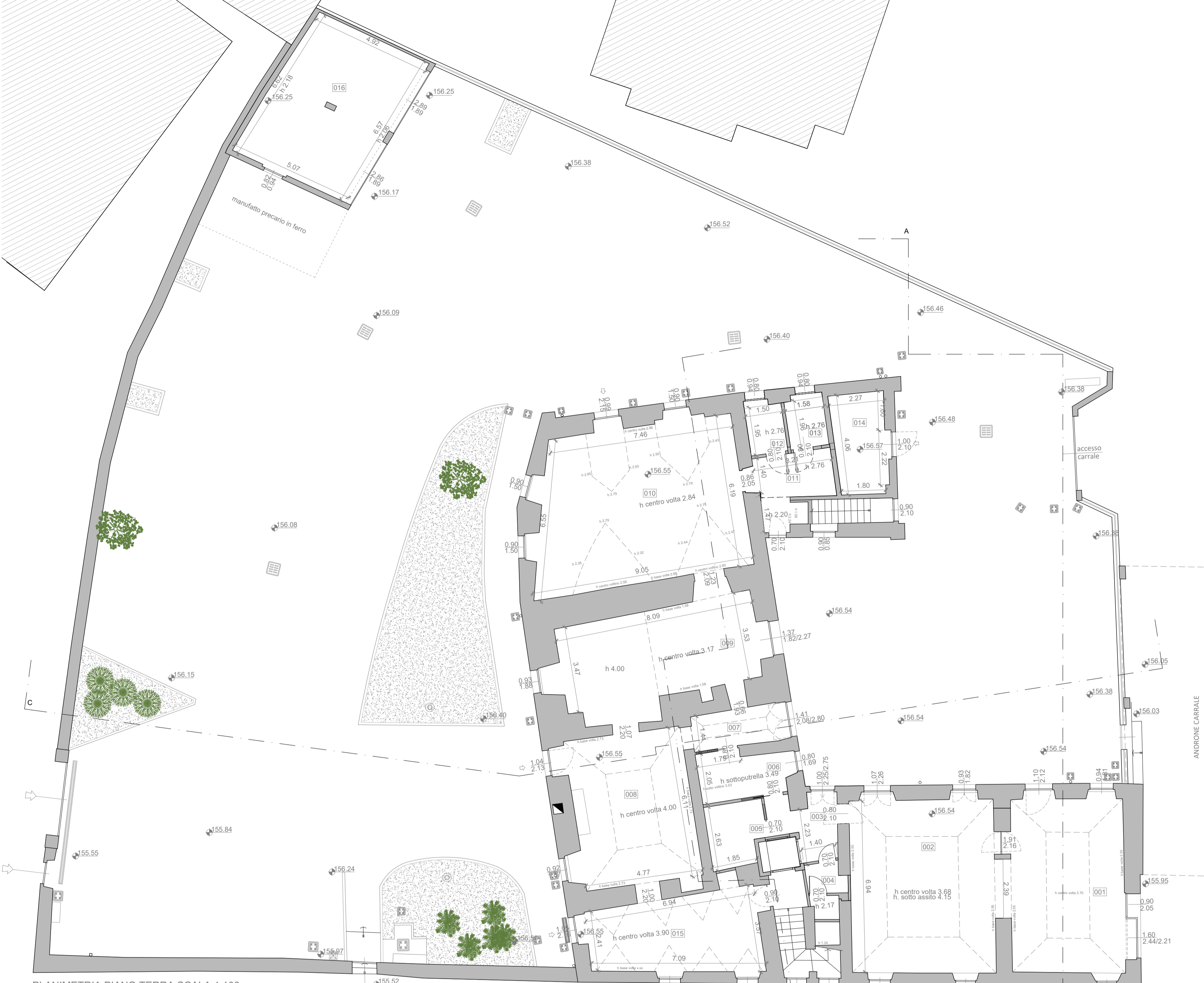
PLANIMETRIA PIANO TERRA SCALA 1:100