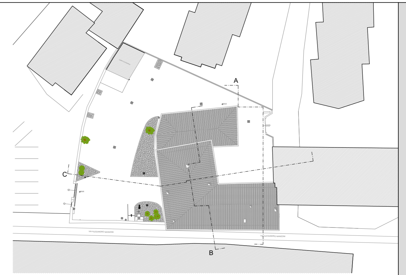
PLANIMETRIA SCALA 1:500