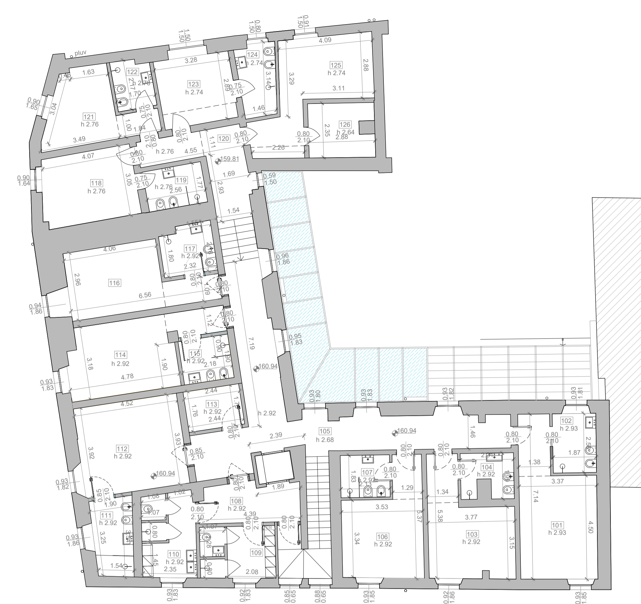
PLANIMETRIA PIANO PRIMO SCALA 1:100

N.B. ● I LOCALI CONTRASSEGNA TI CON QUESTO SIMBOLO AVRANNO ASPIRAZIONE FORZATA IN GRADO DI RICAMBIARE 12 VOLTE * I LOCALI CONTRASSEGNA TI CON QUESTO SIMBOLO NON PREVEDONO PERMANENZA DI PERSONE ▲ I LOCALI CONTRASSEGNA TI CON QUESTO SIMBOLO SONO DOTATI DI IMPIANTO DI CONDIZIONAMENTO ARIA A NORMA R.L.I. v.m.c VENTILAZIONE MECCANICA CONTROLLATA