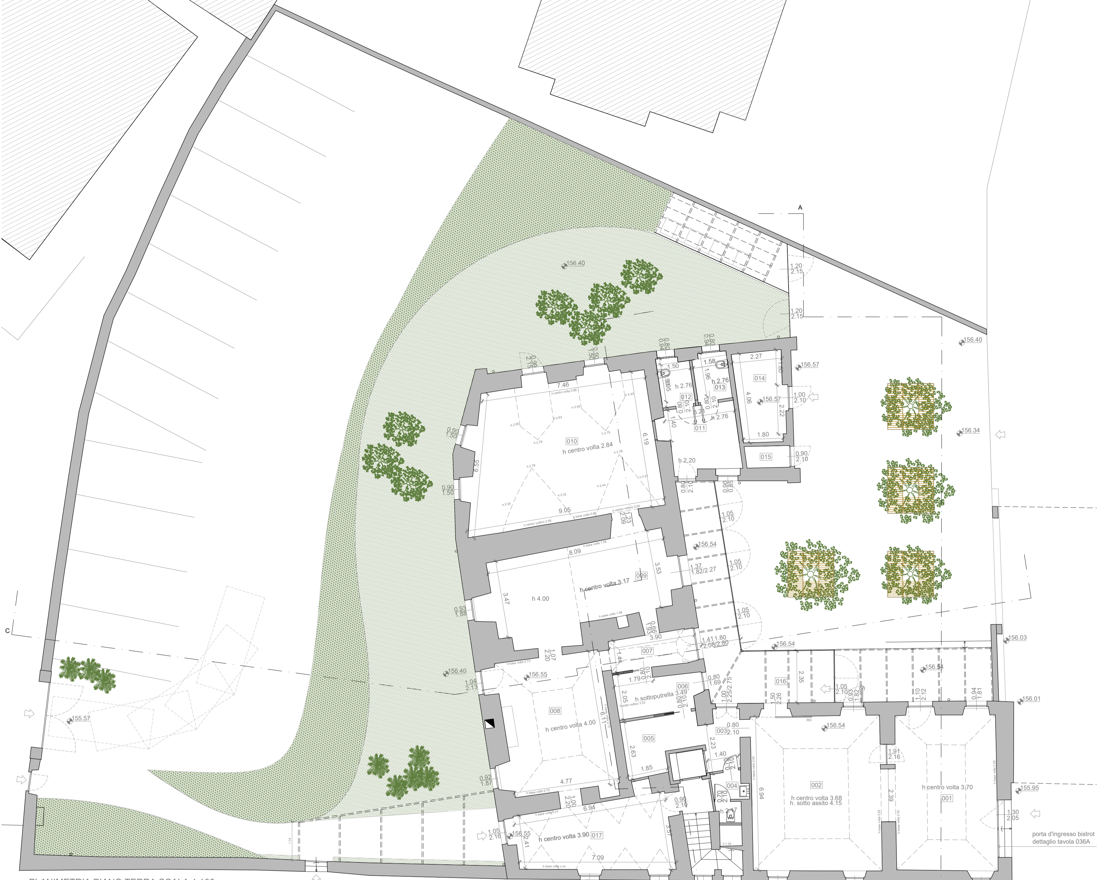
PLANIMETRIA PIANO TERRA SCALA 1:100