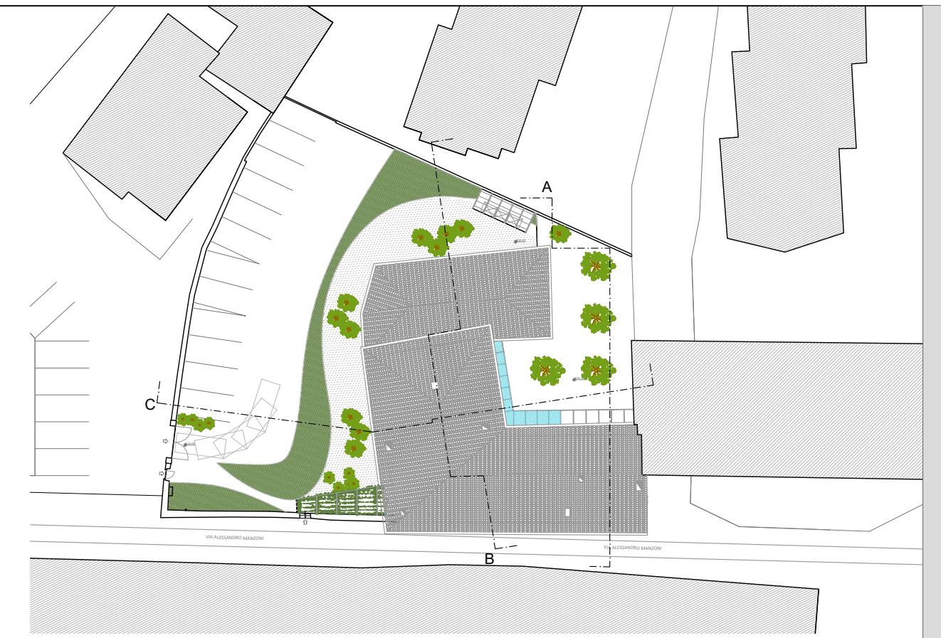
PLANIMETRIA SCALA 1:500