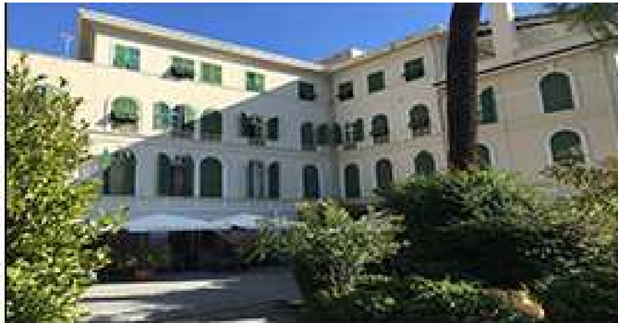
Villa Speranza - Sanremo