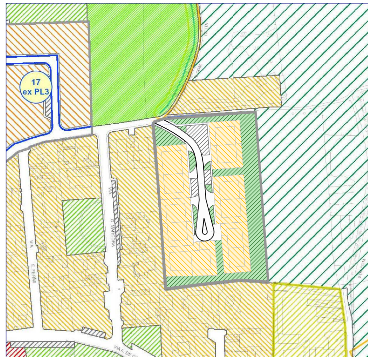
Estratto PdR n2 t1 - Previsioni di Piano - con sovrapposizione nuovo azzonamento PL4 Scala 1:2000