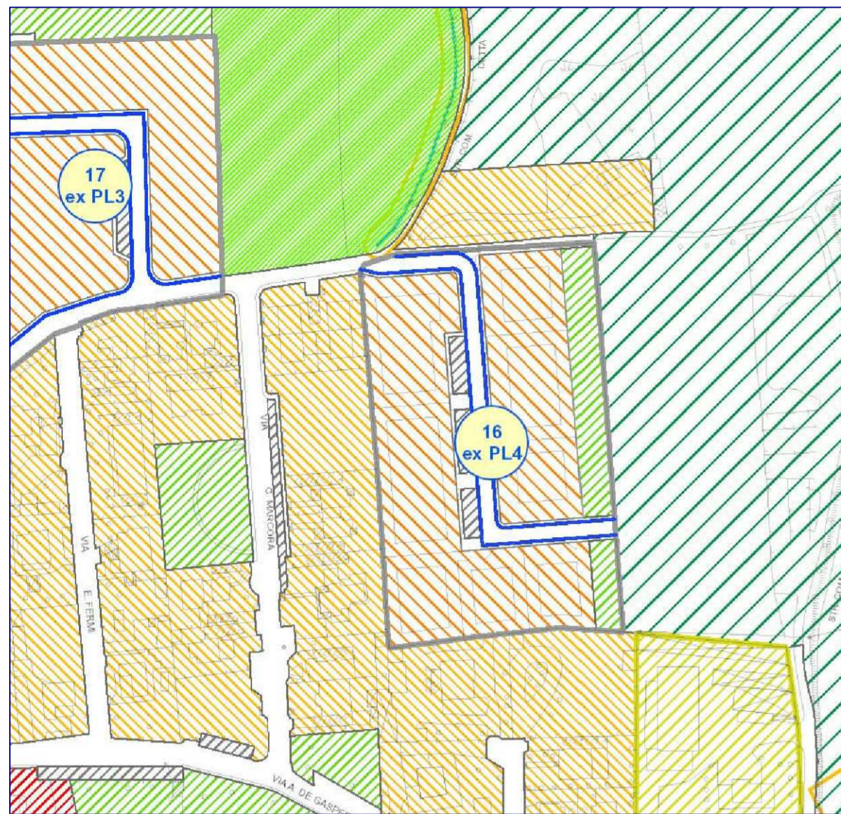
Estratto PdR n2 t1 - Previsioni di Piano Scala 1:2000