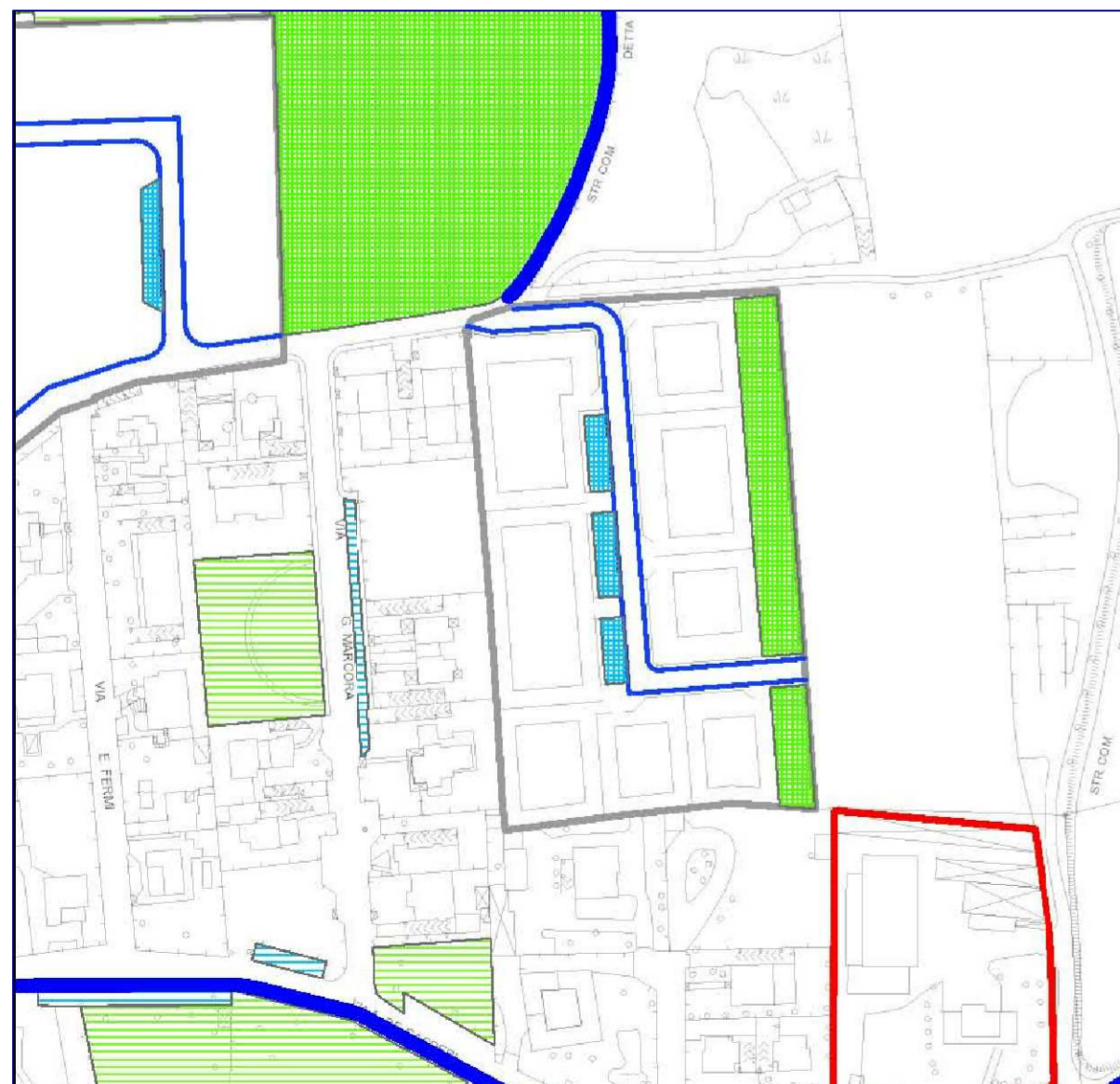
Estratto PdS s1 t3 - Servizi di Progetto Scala 1:2000